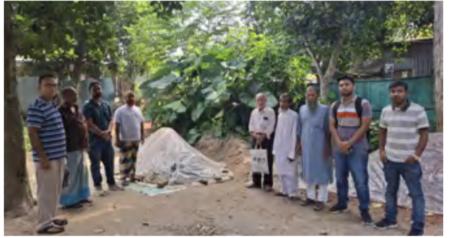
বাল্লা বাজার এলাকায় গবেষক দল

মাধ্যমে সরাসরি জানা যায়, যুদ্ধের সময় পাকিস্তানিরা সেখানকার দুটি বাজারে আঙুন লাগিয়ে দেয়। একটি হচ্ছে আমডালা বাজার, আরেকটি বাল্লা বাজার। সেখানে বেশকিছু প্রাণহানি হয় এবং সমস্ত দোকানপাট পুড়ে ছাই হয়ে যায়। এছাড়া বোয়ালিচক বধ্যভূমি, কয়রা, উখলী, তেওতা নামক স্থানেও ব্যাপক ধ্বংসযজ্ঞ চালায় পাক হানাদার বাহিনী। এখানকার উপজেলা কেন্দ্রীয় আব্দুল গনি সরকার উচ্চ বিদ্যালয়কে দখল করে বানানো হয় টর্চার সেল। মাঠকর্মের মাধ্যমে এরকম আরো অনেক তথ্য উঠে আসে গবেষকদের হাতে। মাঠকর্মের একটি গুরুত্বপূর্ণ অংশ ছিল ঐতিহাসিক সেই সকল স্থানের সঠিক জিপিএস রেকর্ড সংগ্রহ। ভবিষ্যতে নথিপত্র সংরক্ষণের জন্য একটি নির্ভুল ও স্থায়ী রেকর্ড নিশ্চিত করার লক্ষ্যে, গবেষকরা প্রতিটি স্থানের জন্য সুনির্দিষ্টভাবে জিপিএস রেকর্ড করেন। তারা সেখানকার স্থানীয় জনগণ ও বীর মুক্তিযোদ্ধাদের সাথে কথা বলেন এবং ভিডিও সাক্ষাৎকার গ্রহণ করেন। এই সাক্ষাৎকারগুলো থেকে উঠে আসে পাকিস্তানিদের বর্বরতার নানা চিত্র এবং একই সাথে মুক্তিযোদ্ধাদের অসীম সাহসীকতার দৃষ্টান্ত। গবেষণার জন্য ঐতিহাসিক সেই